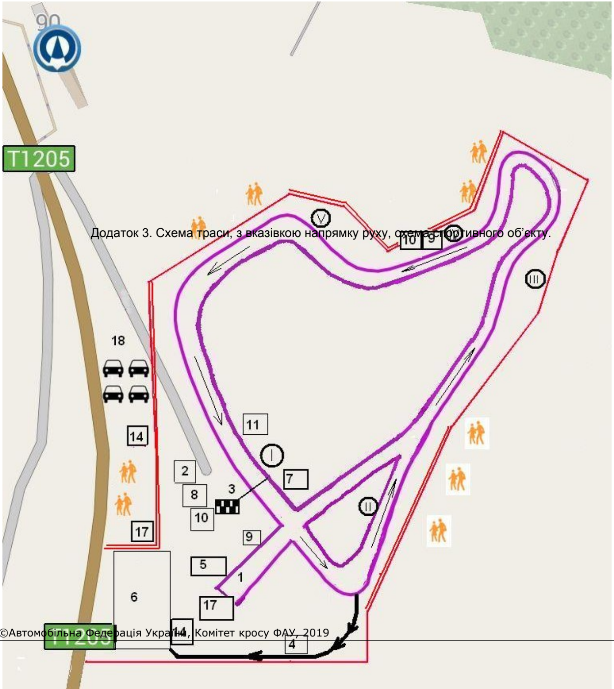
Додаток 3. Схема траси, з вказівкою напрямку руху, окремих транспортних об'єктів.