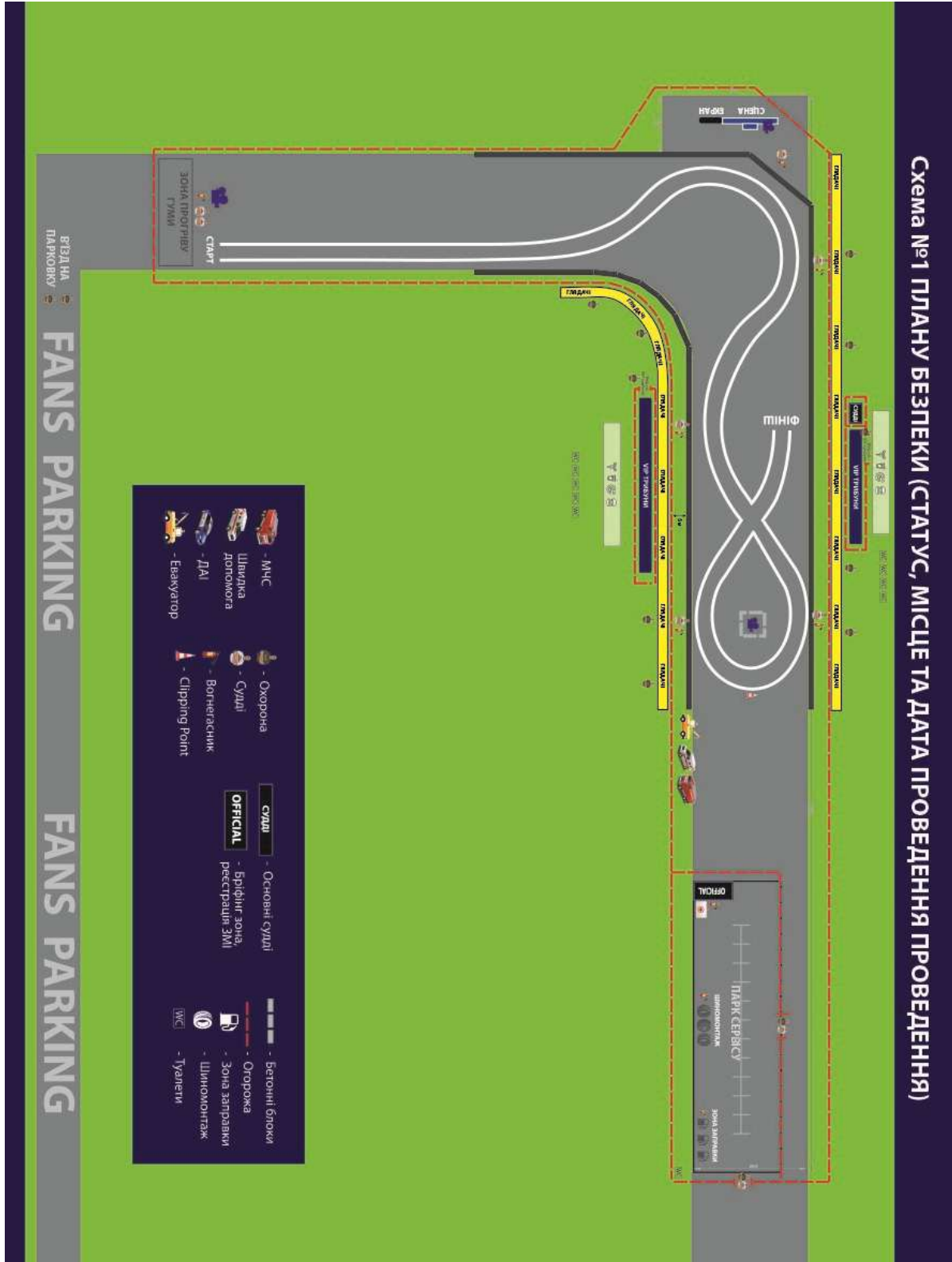
СХЕМА 1 ПЛАНУ БЕЗПЕКИ